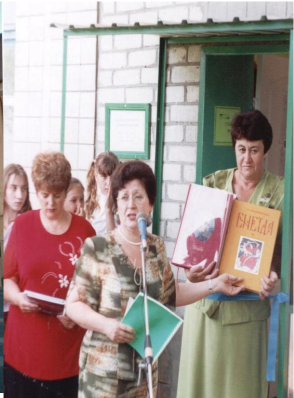
Відкриття сільської бібліотеки у Сахновщинському р-ні Харківської обл. 2005 р.